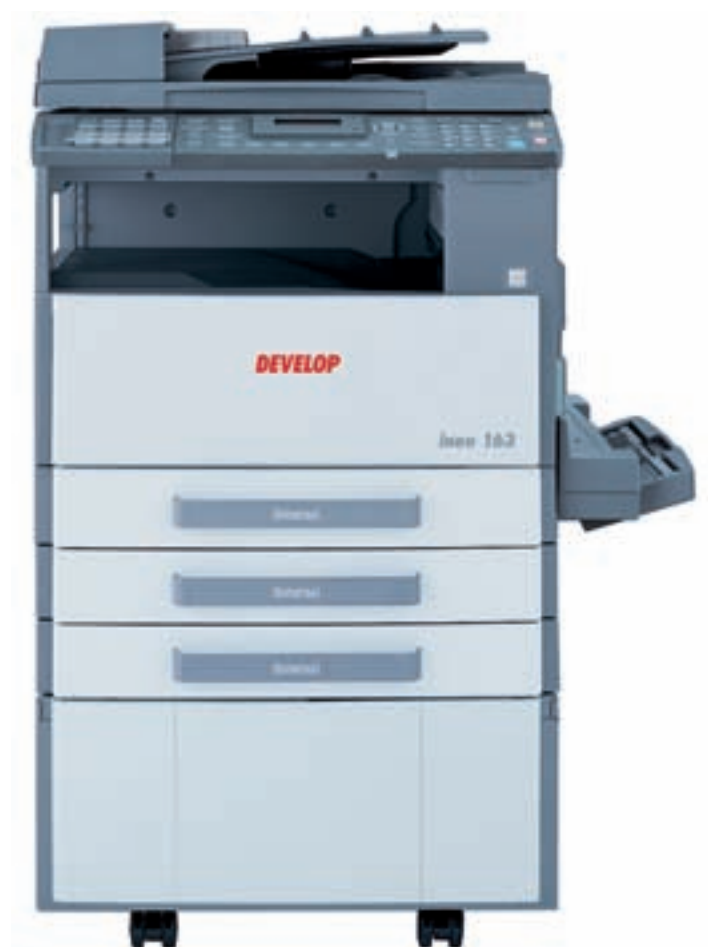
ineo 163 mit Vorlageneinzug DF-502, Multi-Bypass MB-501, kleinem Unterschrank SCD-21 mit zwei Papierkassetten PF-502 und Faxeinheit FK-506

Vor allem für kleine Firmen oder für das gut ausgestattete Home Office ist die ineo 163/213 das ideale Digitalsystem. Sie ist kostengünstiger und schneller als ein Tintenstrahldrucker, Drucken und Scannen ist optional auf Netzwerk-basis möglich – und nicht zuletzt verarbeitet sie Formate von DIN A5 bis A3. Große Leistung zu kleinem Preis ist genau das, was dieses kompakte, multifunktionale System bietet.